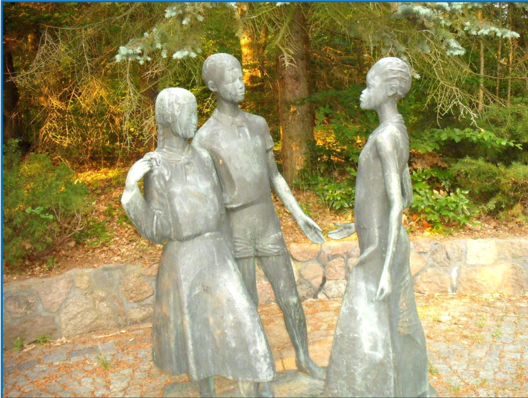
Diese Plastik von Schiefelbein steht seit 1960