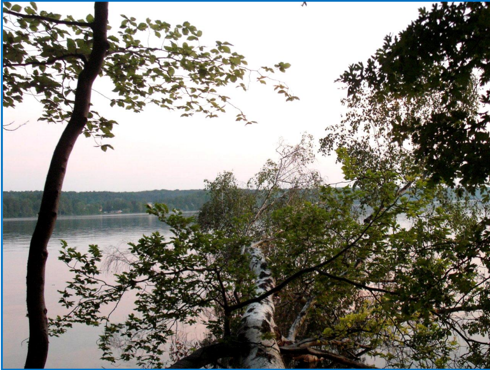
Fast unberührte Natur am Werbellinsee – aber es gab auch Badestrand und Strandgaststätte