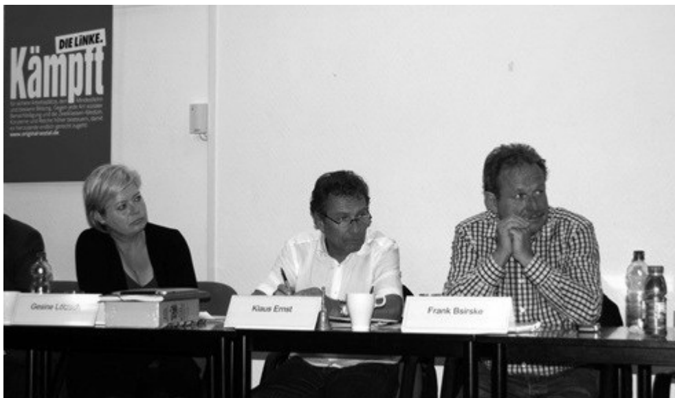
Gesine Löttsch, Klaus Ernst und Frank Bsirske

Anlässlich ihrer Sitzung am 25. September begrüßten die Mitglieder des Vorstandes der Partei DIE LINKE. den Vorsitzenden der Gewerkschaft ver.di, Frank Bsirske, um sich zu den Auswirkungen des Kürzungspakets der Regierungskoalition, zur Rente erst ab 67, zur Notlage der Kommunen und zur Gesundheitsreform zu verständigen.