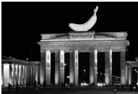
Vorschlag für ein Einheitsdenkmal

des Eisberges leicht angepickt. Denn wirkliche Einheit setzt Gleichheit auf allen Gebieten voraus. Und da liegt auch nach 20 Jahren noch vieles im Argen.