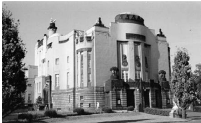
Veranstaltungsort Cottbuser Staatstheater

All dies ist in seriösen wirtschaftswissenschaftlichen Studien nachzulesen, die sich vor allem auf offizielle Zahlen der Deutschen Bundesbank beziehen.