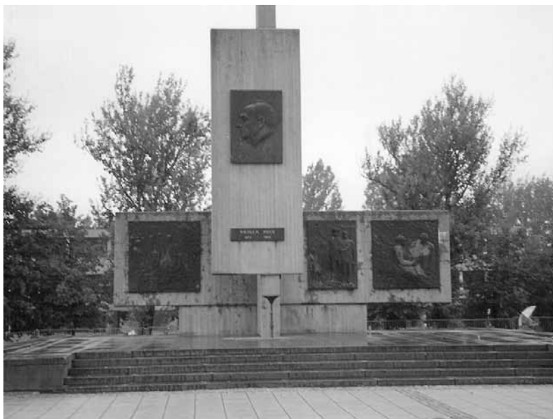
Das Wilhelm-Pieck-Monument in Guben

Obwohl er bei der Grundsteinlegung der Schule am 7. Juli 1951 letztmalig in Guben weilte, verlor er niemals den Kontakt zu seiner Stadt, denn oftmals empfing er in seinem Amtssitz in Berlin-Hohenschönhausen Delegationen aus unserem Ort, ließ sich dabei über die Entwicklung berichten, gab Hinweise und Ratschläge.