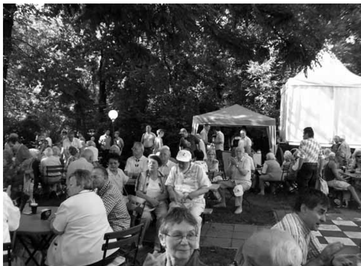
Das Sommerfest war gut besucht