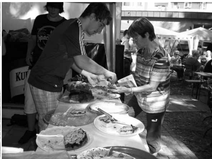
Die Jugend verteilte süße Sachen