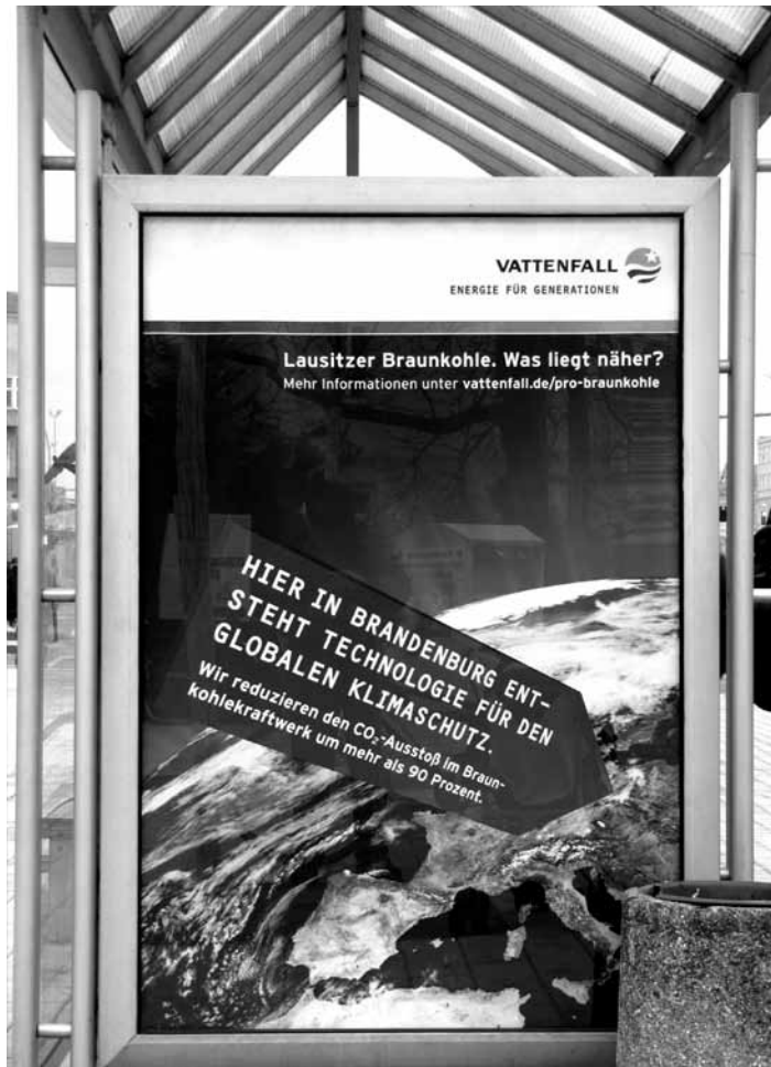
Es gibt keinen dauerhaften CO 2 - Müllkübel

Text und Foto: Dieter Brendahl, Dipl.-Ing. (FH) Automatisierung und Elektrotechnik, Mitglied der LINKEN im Kreisverband DIE LINKE.Lausitz