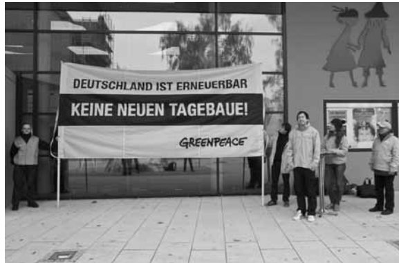
Berechtigte Forderung vor dem Piccolo-Theater

Am 5. November lud der Landesverband zur Regionalkonferenz für Südbrandenburg nach Cottbus ein.