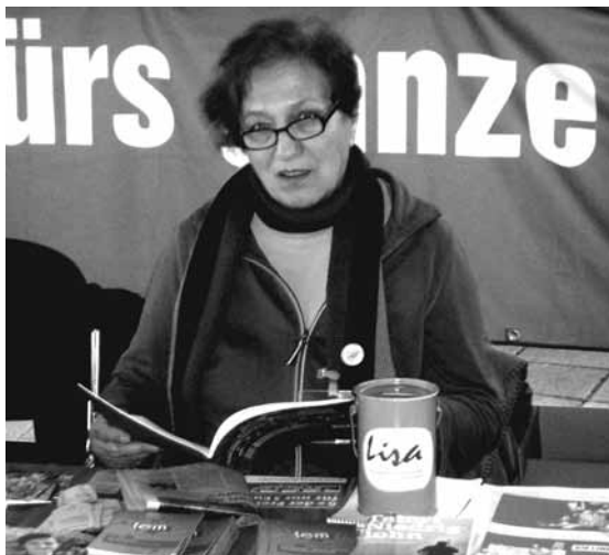
Die Autorin als Betreuerin des LISA-Standes