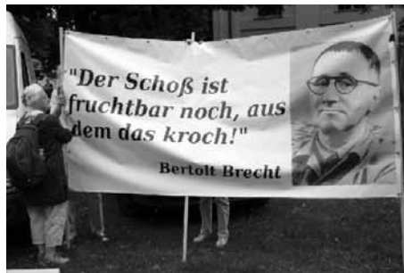
Plakat in Neuruppin

stellten sich zehn Juden hin, dann kamen die Leute mit der Maschinenpistole und schossen die um, und dann fielen die in die Grube. Dann kamen die Nächsten vorne aufgestellt, und fielen auch wieder in die Grube, und die anderen warteten eine Weile, bis sie erschossen wurden. Da wurden Tausende von Leuten erschossen. Das hat man nachher gelassen und vergast. Da waren doch manche nicht tot, und dann wurde Erde zwischendurch überschüttet, eine Schicht. Dann waren Packer da, die packten die Leute, weil sie