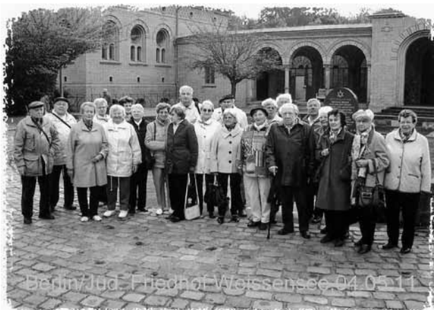
Die Teilnehmer an der Fahrt der AG Senioren

Bericht über die Fahrt der AG Senioren am 4. Mai