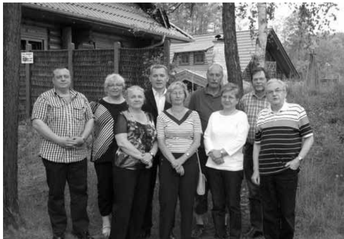
Die Abgeordneten und Nachfolgekandidaten der LINKEN aus Kolkwitz, Burg und Werben (fast) vollständig