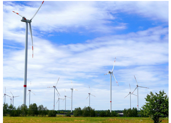
Windpark in Klettwitz, Landkreis Oberspreewald-Lausitz

Kriterien für den Ausbau werden zwar durch das Land emp-